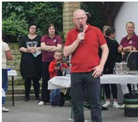
Das Team vom Fachtierarzt-Zentrum für Kleintiere auf dem Amtmann-Kästner-Platz hatte aus Anlass ihres 25jährigen Bestehens zum Tag der Tiergesundheit eingeladen.

Am 9. Juni beging die Gartengaststätte „Nach Feierabend“ ihr 30jähriges Bestehen.