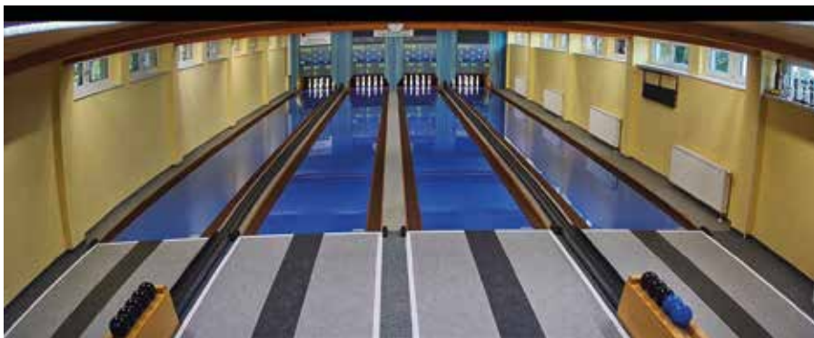
Das Bild zeigt die Innenansicht unserer Kegelbahn beim Sportplatz in der Bernauer Straße, die mit Sicherheit ein Großteil der Gisperslebener noch nicht zu Gesicht bekommen hat.