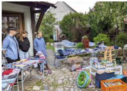
Ganz Gispersleben war am 25. Mai ein Trödelmarkt.