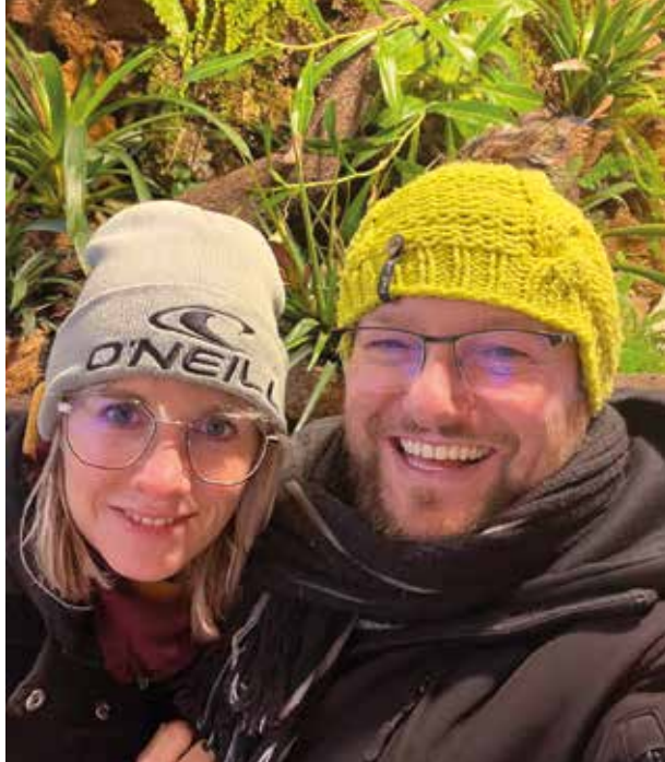
Kraft tankt unser Ortsteilbürgermeister in Familie mit seiner Lebensgefährtin (Foto) und seinen beiden Söhnen.

Bemerkenswert war wieder die Beteiligung an der Flurfege im Frühjahr und Herbst. Das behalten wir sehr gern bei und sagen noch einmal Dankeschön an jeden, der dabei war und Gispersleben von Unrat befreit hat, der einfach so irgendwo abgelegt wird. Ich weiß, dass es auch viele Aktivi-